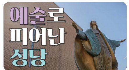
(코너3) 대신 가드립니다