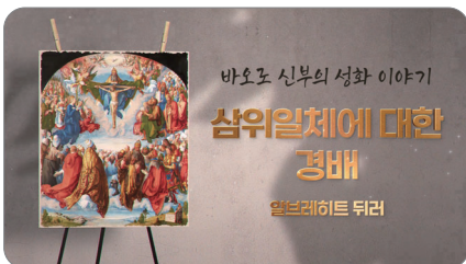
(코너1) 바로로 신부의 성화 이야기

가톨릭튜브는 가톨릭교회의 여러 가지 소식과 정보, 가톨릭 문화를 즐겁고 유익하게 전합니다. 또한 서울주보에 담지 못한 내용을, 영상을 통해 깊이 있게 전달하는 서울주보 연계 코너도 운영하고 있습니다. 서울주보 표지의 성화를 통해 주일 복음을 묵상하는 <바로로 신부의 성화 이야기>, 재미있는 영화를 교회의 시각에서 바라보며 감상하는 <비하인드 영화칼럼>, 교회 내 다양한 장소를 대신 방문해 소개하는 <대신 가드립니다> 코너가 있습니다.