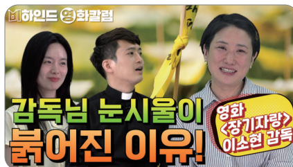
(코너2) 비하인드 영화칼럼