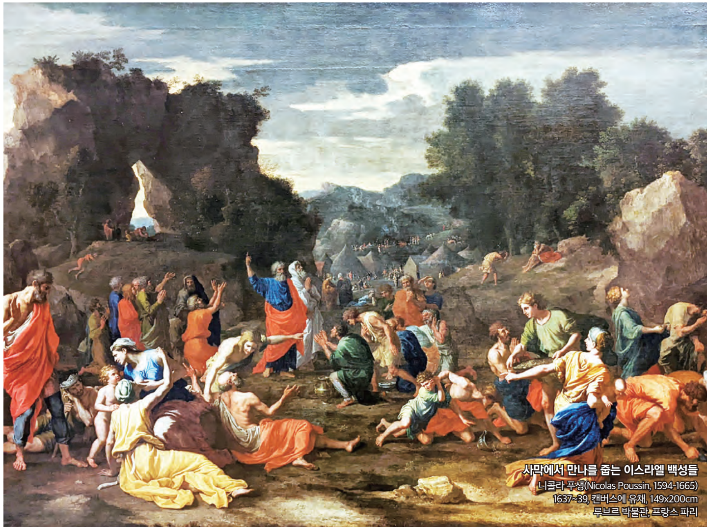
사막에서 만나는 이스라엘 백성들 니콜라 푸생(Nicolas Poussin, 1594-1665) 1637~39, 캔버스에 유채, 149x200cm 루브르 박물관, 프랑스 파리