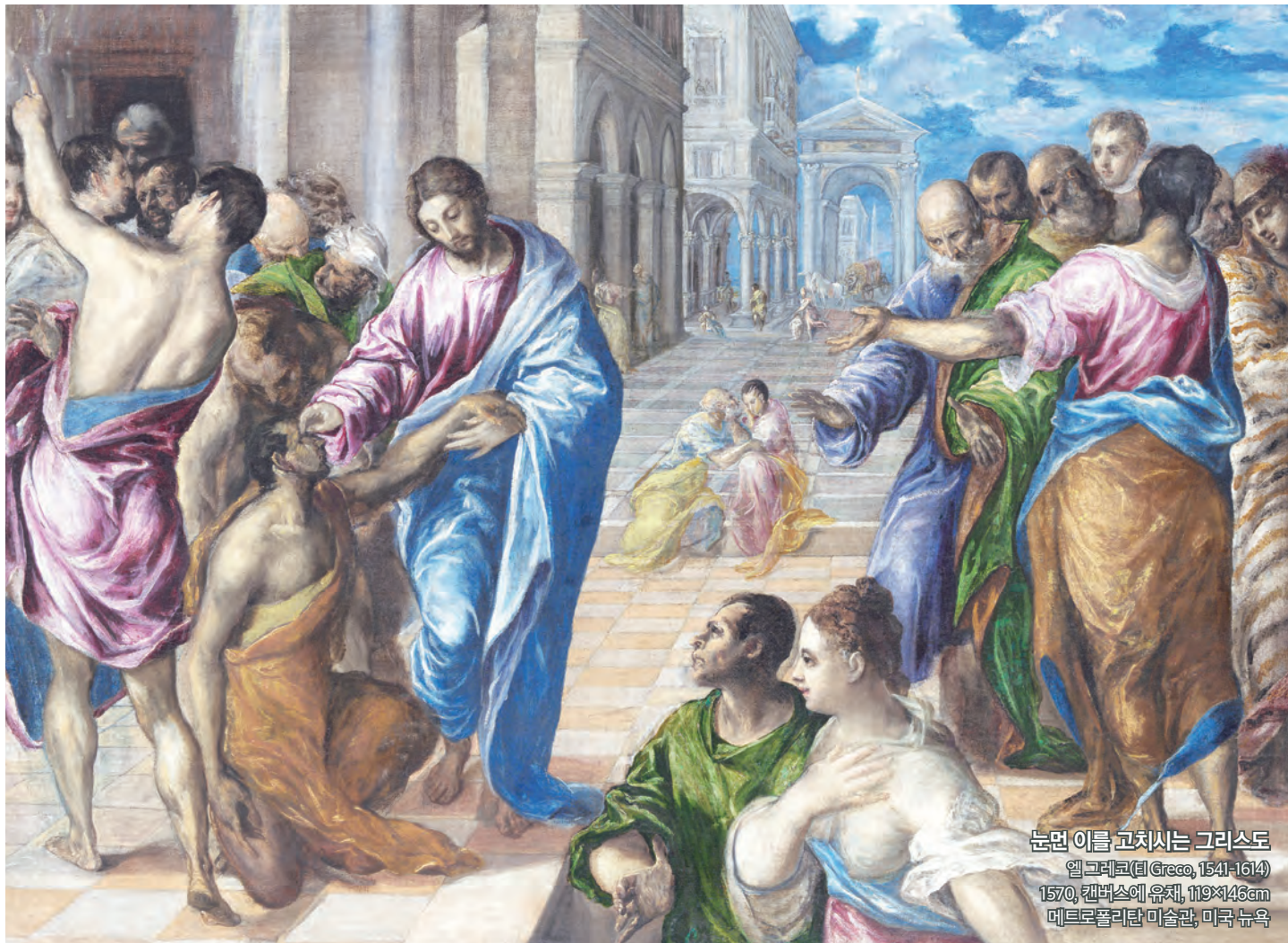
눈먼 이를 고치시는 그리스도 엘그레코(El Greco, 1541-1614) 1570, 캔버스에 유채, 119x146cm 메트로폴리탄 미술관, 미국 뉴욕