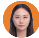
교육부 김유진 아녜스