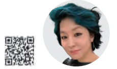
한젬마젬마 | 그림 이어주는 여자

제 나이 서른이 되기 전에 반드시 저를 결혼시켜야겠다는 생각에 올인하신 부모님은 독실했던 당신들의 믿음에도 불구하고 사위될 사람의 종교도 따지지 않고, 호텔 결혼식장을 빌려 골수(?) 불교 집안으로 저를 시집보냈습니다. 아니, 보통은 “내 딸과 결혼하려면 세례는 받고 오게나.” 정도는 해야 하는 거 아닌가요? 시할아버님, 시할머님 장례는 당연히 불교식으로 상여 메고 절에서 치러드렸고, 시아버님의 확고한 통보하에 제사도 정통 유교식으로 치렀습니다. 이러한 시부모님의 영향으로 엉겁결에 범명도 얻은 저는 철저히 불교 예절과 유교 제사 예법을 따르는 천주교 며느리로 맹활약했습니다. 성당은 제사를 다 치른 다음에야 갔습니다.