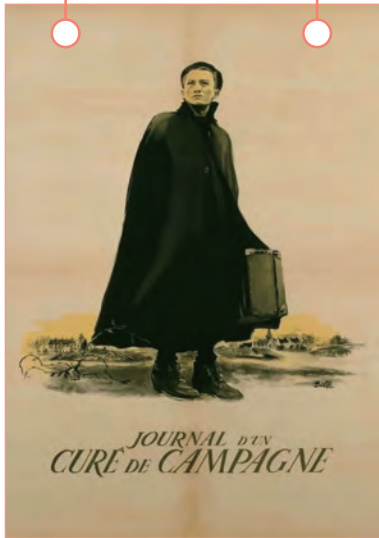
1951년 작, 감독 '로베르 브레송'