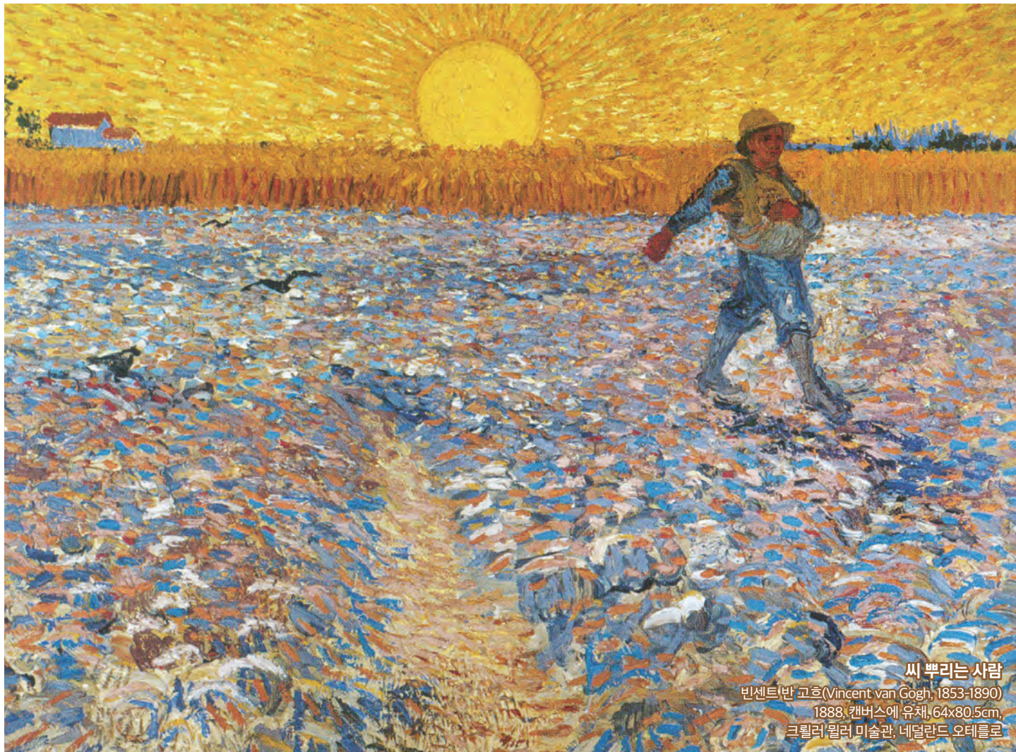
씨 뿌리는 사람

빈센트 반 고흐(Vincent van Gogh, 1853-1890) 1888, 캔버스에 유채, 64x80.5cm, 크릴러 밀러 미술관, 네덜란드 오테를로