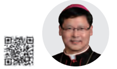
정순택 베드로 대주교 | 서울대교구장

오늘은 연중 제22주일이자 9월 '순교자 성월'에 맞는 첫 번째 주일입니다. 또한 매년 9월 1일은 '피조물 보호를 위한 기도의 날'이기도 합니다. '공동의 집'인 지구 환경을 지키기 위해 2015년부터 프란치스코 교황님께서서는 동방 정교회에서 먼저 시작한 이 기도의 날에 우리도 동참하도록 정하셨습니다.