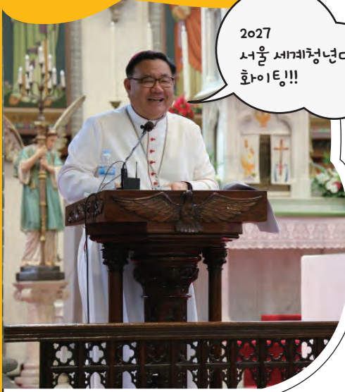
2027 서울 세계청년대회 화이팅!!!