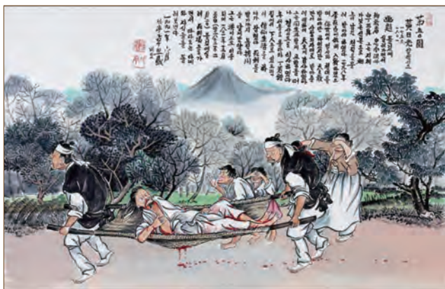
*모진 형벌에 다리가 부러져 들것에 실린 채 형장인 고향 홍주로 압송되는 복자 황일광 시몬(탁희성 화백)

복자 황일광 시몬은 홍주의 천한 백정이었습니다. 그는 갖은 천대 속에 쓰레기 취급을 받고 살았습니다. 그런 그가 41세 때 홍산으로 이존창을 찾아가 신앙을 받아들이면서 문득 새 삶이 시작되었습니다. 이후 그는 아우 황차돌과 함께 경상도로 옮겨가서 살았습니다. 오로지 충직으로 주님을 섬기던 그들 형제에게 모종의 역할이 맡겨진 것입니다.