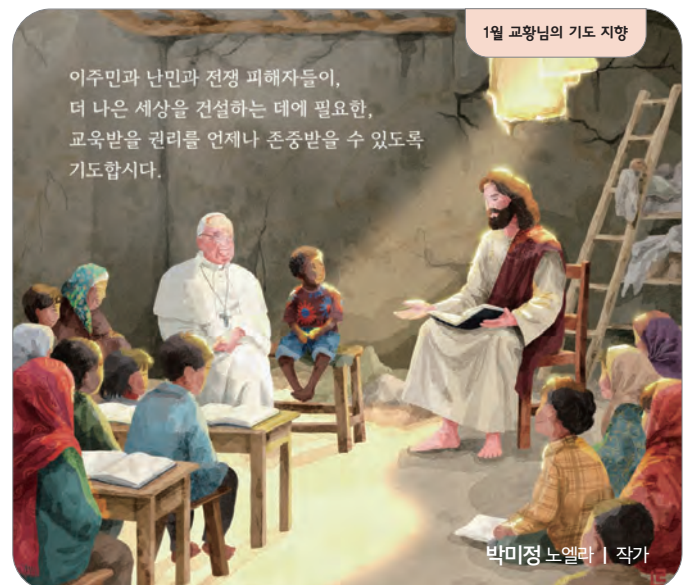
1월 교황님의 기도 지향

칠레의 남쪽 사람들은 친절하고 사랑이 넘칩니다. 사람에 대한 관심도 많고, 남을 위해 자신의 시간을 내어주는 일에 관대합니다. 처음 보는 이방인 수녀에게 보인 그들의 환대는 제가 가던 길을 멈추고 그들과 함께 수다를 떨 수 있는 여유를 갖게 해 주었습니다. 가끔은 자동차를 세운 후, 어디서 왔느냐, 여기 온 지는 얼마나 되었느냐 묻는 바람에 어이가 없기도 했지만, 생각해 보면 주저 없이 다가와 주었던 이 친절하고 사랑 넘치는 사람들 덕분에 이곳에서의 적응도 가능했구나 하는 생각이 듭니다. 20년이라는 시간이 짧지는 않습니다. 하지만 이 친절하고 사랑 넘치는 사람들을 나누기 위해서는 아직도 더 많은 시간이 필요한 것 같습니다. 주님께서 허락하시는 만큼 저도 제 시간과 가진 것, 그리고 생명까지 내놓을 수 있기를 간절히 바랍니다.