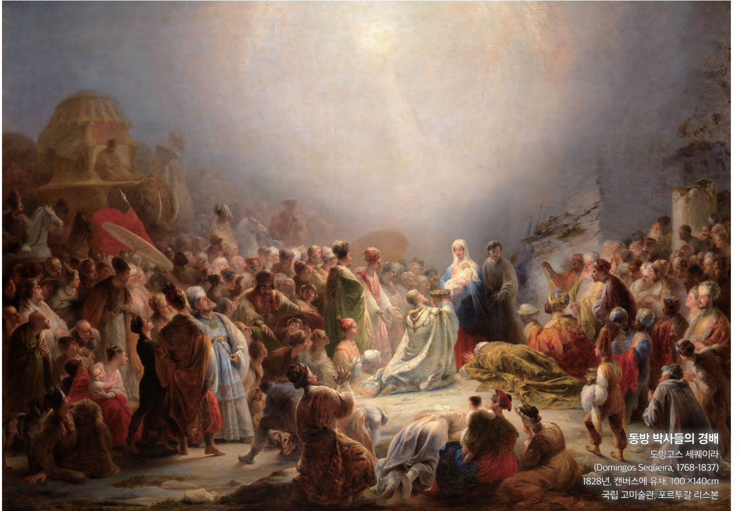
동방 박사들의 경배