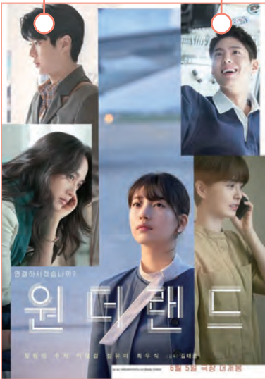
2024년 작, 감독 '김태용'