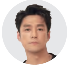
지진희 요한 | 연기자

저는 연기를 정식으로 배워본 적이 없습니다. 연기를 하고 싶다는 생각을 해본 적도 없으니 당연한 일이죠. 그저 우연한 기회에 연기자의 길로 들어섰고 대중의 사랑을 받게 되어 지금까지 왔을 뿐입니다. 그러니 제가 연기를 잘해서 대중의 사랑을 받고 꾸준히 연기 생활을 할 수 있다고 생각하지 않습니다. 그저 하나님의 은총이 있었을 뿐이죠. 실제로 주변을 둘러보면, 연기를 정말 잘하는 배우인데 기회가 없어서 작품을 하지 못하고 대중에게 큰 주목을 받지 못하는 경우가 많습니다. 반대로 연기를 그렇게까지 잘하지 않지만, 꾸준히 배우 생활을 하는 저 같은 사람도 있죠. 그래서 저는 연기를 잘하지만 기회를 얻지 못하는 배우들에게 예의를 갖추기 위해서라도 연기가 무엇인지 진지하게 생각해야 한다고 생각했습니다. 다른 배우에 비해 늦게 연기에 대한 고민이 시작된 것이죠. 늦은 만큼 저의 고민은 깊고 진지했습니다. 다른 사람이 된다는 것은 어떤 것인지, 어떤 노력이 필요한지 역할을 맡을 때마다 고민했습니다.